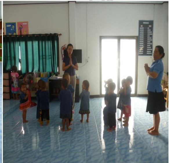
กิจกรรมเข้าแถว ฝึกระเบียบวินัย อดทน รอคอย รู้จักลำดับ ก่อน-หลัง กิจกรรมพัฒนาผู้เรียน