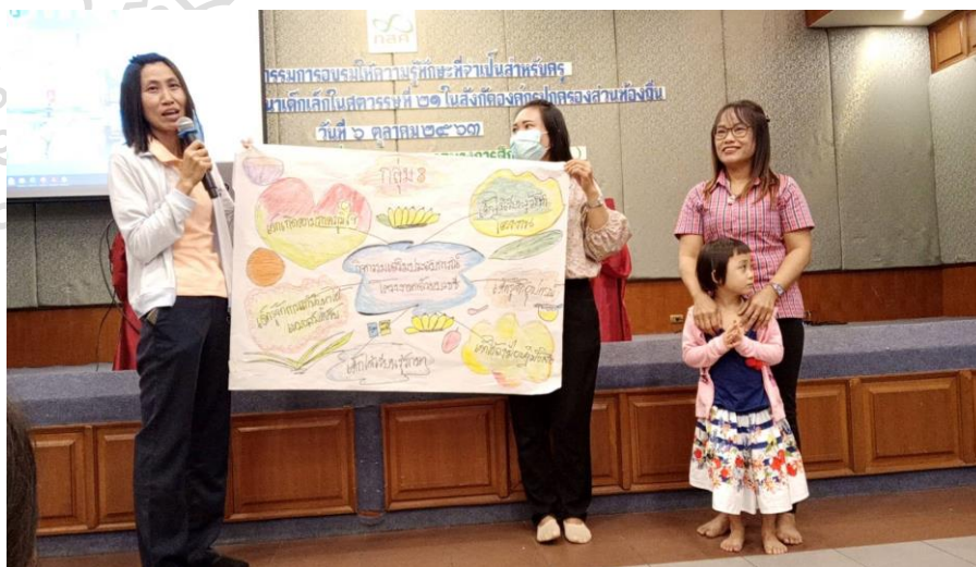
เข้าร่วมการอบรมเชิงปฏิบัติการ เพื่อนำความรู้มาถ่ายทอดเพื่อนร่วมงาน และพัฒนาผู้เรียนและสถานศึกษา กิจกรรมพัฒนาบุคลากรครู