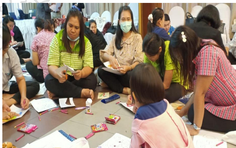
อบรมผลิตสื่อและนวัตกรรมเพื่อพัฒนาผู้เรียน