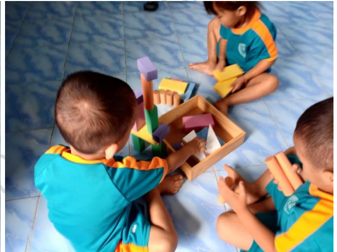
การจัดกิจกรรมส่งเสริมและปลูกฝัง การแบ่งปัน รอคอย และความมีระเบียบวินัย และส่งเสริมการอยู่ร่วมกันอย่างมีความสุข ภาพกิจกรรมการพัฒนาผู้เรียน