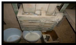
โรงสีข้าว