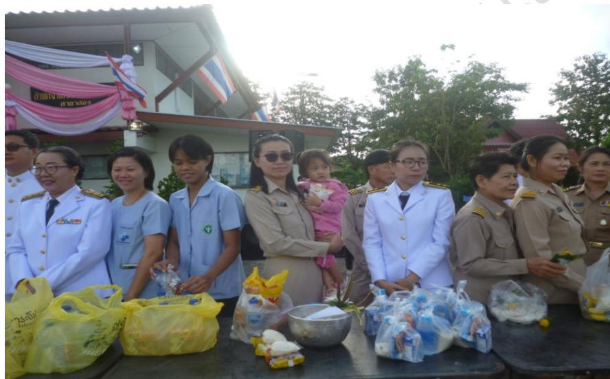
ร่วมตักบาตรวันปิยมหาราช ร่วมกับข้าราชการ พนักงาน พลเรือนทุกหมู่เหล่า ณ ที่ว่าการอำเภอสอง