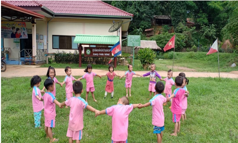
การจัดกิจกรรมศึกษาส่งเสริมความกล้าแสดงออกที่สร้างสรรค์ เพื่อให้เด็กสามารถแสดงความสามารถ และกล้าแสดงออกอย่างสร้างสรรค์ พัฒนากล้ามเนื้อมัดใหญ่