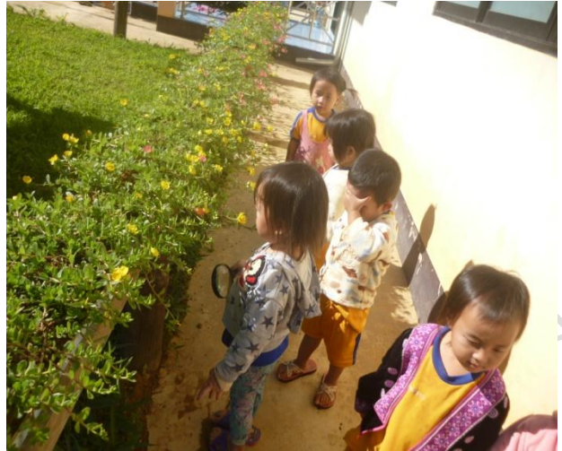
การจัดกิจกรรม ใน และนอกห้องเรียน ศึกษานอกสถานที่ เด็กได้เรียนรู้ ฝึกสังเกต