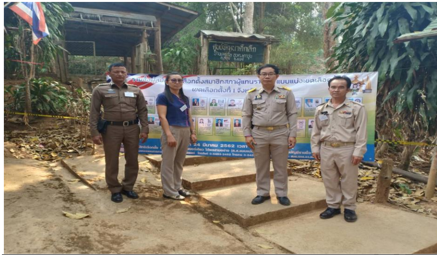
คณะครูศูนย์พัฒนาเด็กเล็กบ้านแม่แรม เป็นกรรมการประจำหน่วยเลือกตั้งที่ ๑๓ บ้านแม่แรม หมู่ที่ ๑๒