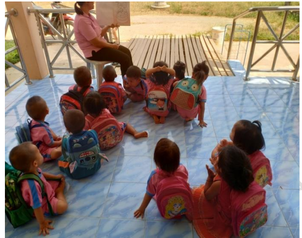
การจัดกิจกรรมส่งเสริมพัฒนาการด้านส่งเสริมภาษา เพื่อส่งเสริมพัฒนาการทางอารมณ์-จิตใจ, สังคม ,สติปัญญาและส่งเสริมการเรียนรู้ ศิลปะ สุนทรียภาพ เด็กได้แสดงความคิดอิสระอย่างสร้างสรรค์