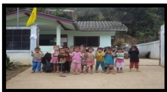
สถานบริการสาธารณสุขชุมชนบ้านแม่แรม