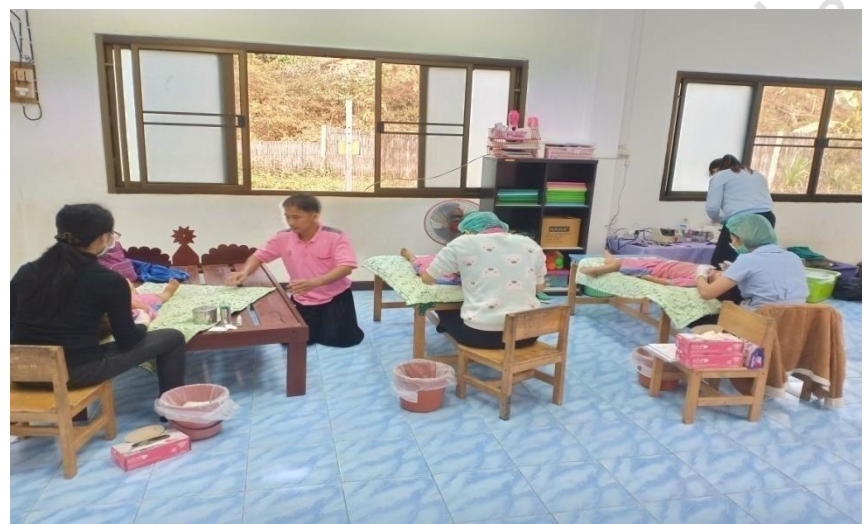
การตรวจสุขภาพฟัน โดยทันตแพทย์ รพ.สต.เตาปูน และโรงพยาบาลสอง เพื่อส่งเสริมพัฒนาการเด็กปฐมวัย ภาพกิจกรรมการพัฒนาผู้เรียน