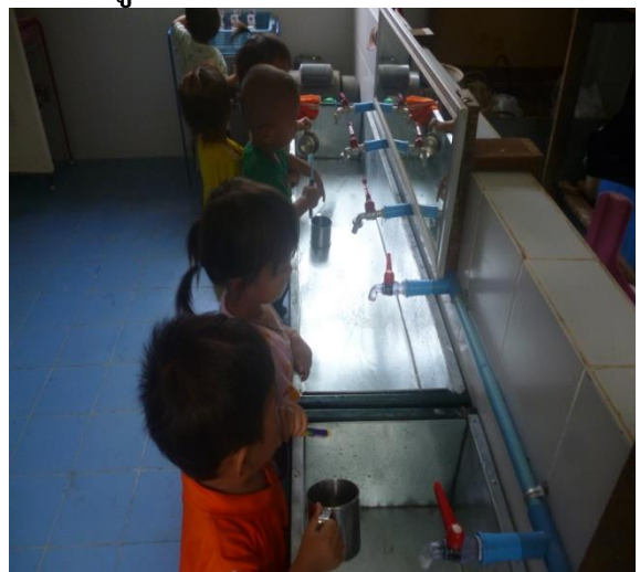
กิจกรรมส่งเสริมทักษะในชีวิตประจำวันการช่วยเหลือตนเอง และปลูกฝังนิสัยรักความสะอาด