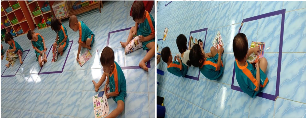
การจัดกิจกรรมสร้างสรรค์พัฒนากล้ามเนื้อมัดเล็ก ใช้กรรไกรตัดกระดาษ ภาพกิจกรรมการพัฒนาผู้เรียน