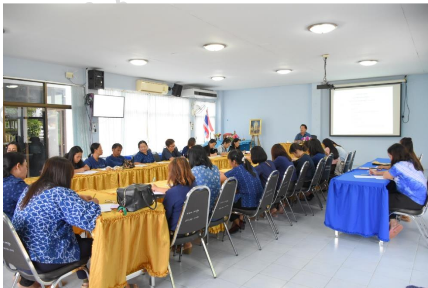
การเข้าร่วมประชุมประจำเดือน กับข้าราชการ พนักงาน องค์กรบริหารส่วนตำบลเตาปูนอย่างสม่ำเสมอ กิจกรรมพัฒนาบุคลากรครู