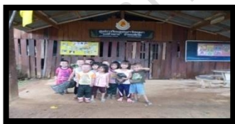
ศูนย์การเรียนรู้แม่ฟ้าหลวง