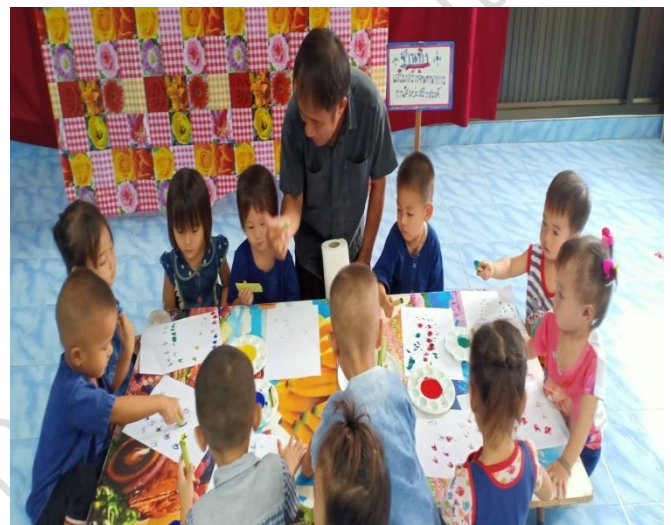
คณะกรรมการศูนย์พัฒนาเด็กเล็ก ผู้ปกครอง เปิดงานโครงการวันวิชาการระดับปฐมวัยเป็นโครงการส่งเสริม และพัฒนาผู้เรียนระดับปฐมวัยศูนย์พัฒนาเด็กเล็กบ้านแม่แรม