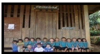
ศาลาเอนกประสงค์/ที่ประชุมหมู่บ้าน