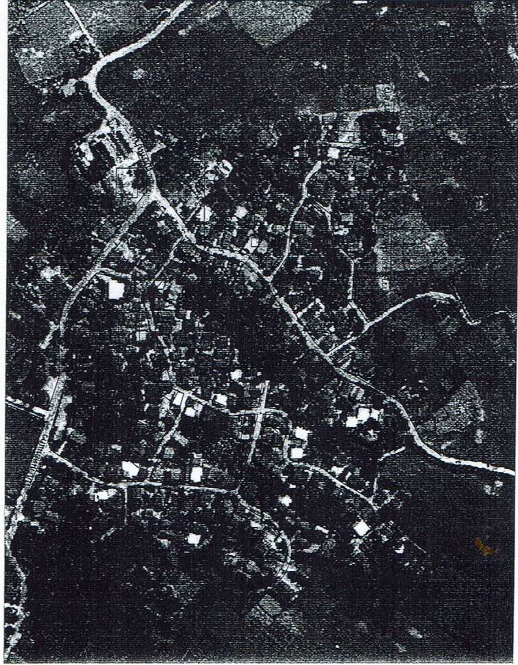
แผนที่สังเขป

หรือพื้นที่ดำเนินงานไม่น้อยกว่า 1,805.20 ตารางเมตร