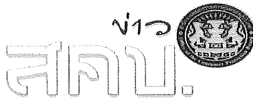
สำนักงานอกรุชมแห่งประเทศไทย