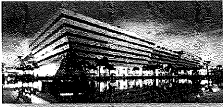
สำนักงานคณะกรรมการคุ้มครองผู้บริโภค